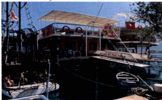
Fotografija lokacije - akvatorij ispred kat.parcele 2012 KO Đuraševići.

- na lokaciji Obala Đuraševića u akvatorijumu ispred kat.parcele broj 2012 KO Đuraševići (parcela državno vlasništvo) i u akvatorijumu ispred kat. parcele broj 167 KO Đuraševići ( dio ponte koja ne postoji u kat.operatu) su organizovana nelegalna privezišta sa pripadajućim vezovima (plovni objekte vezani krmom za obalu pojačani pramčanim murinzima).