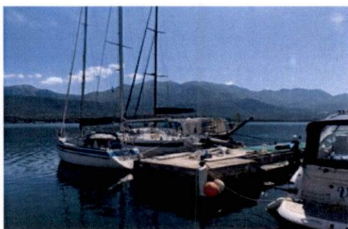
Fotografija lokacije - akvatorij ispred kat.parcele 167 KO Đuraševići

Kako se radi o nedozvoljenim aktivnostima bez odobrenja i dozvole, potrebno je izvršiti kontrolu iz nadležnosti Lučke Kapetanije.